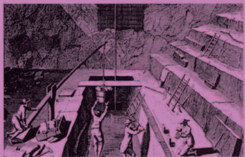
Encyclopédie, Minéralogie, Ardoises d'Anjou, l'extraction des ardoises.

Autrefois l'ardoise était posée au clou en cuivre sur un voligeage (planches jointives). Au XIX ème siècle, la pose au crochet sur liteaux (crochet en cuivre ou inox noir) se répand. Elle est aujourd'hui la plus utilisée. La pose au clou permet pourtant une plus grande souplesse d'utilisation (formes et formats variés d'ardoise), des toitures aux volumes complexes (tourelles, dômes, lucarnes ...) et de la finesse dans les détails.