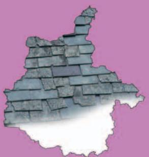
Carte de répartition des toits en ardoise dans les Ardennes.

Le massif ardennais est composé pour une bonne part de schiste, dont on tire l'ardoise. De tout temps les hommes ont tiré du sol leurs matériaux de construction, d'où l'utilisation dominante de l'ardoise dans la région pour les toitures et les bardages. Cette particularité marque fortement l'identité visuelle d'une grande partie du département. Associés au vert sombre de la végétation, aux nuances chaudes de la pierre ou de la brique, les reflets lumineux de l'ardoise naturelle sont un élément fort du patrimoine local.