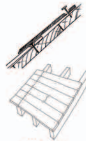
Pose au clou sur volige.