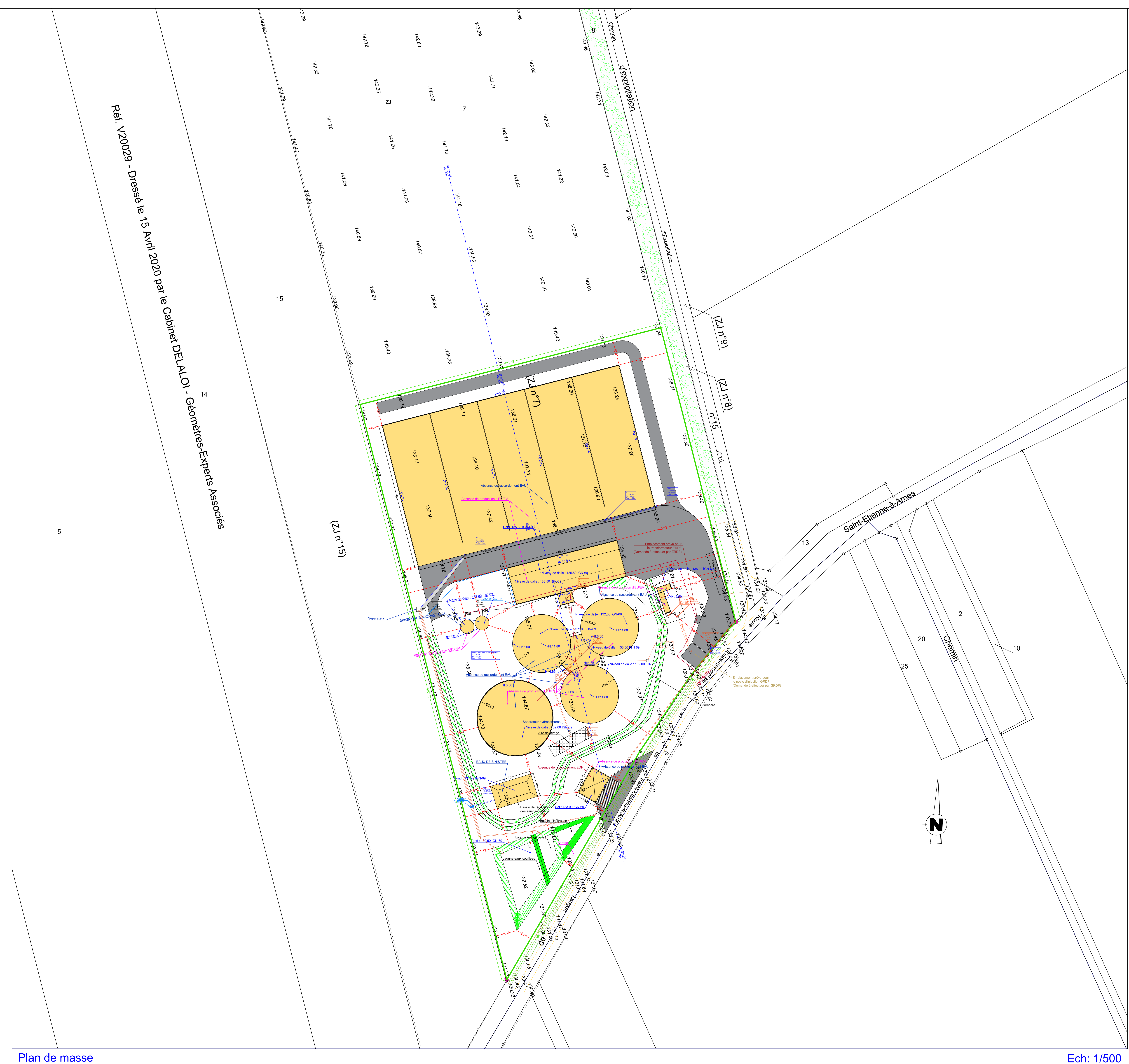
Plan de masse Ech: 1/500

Plan réalisé sous l'entière responsabilité du maître d'ouvrage et remis à titre indicatif ou à des fins administratives. Non valable pour exécution.