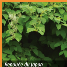
Renouée du Japon

brûlés (3) : La pratique du brûlage à l'air libre doit respecter la circulaire du 18 novembre 2011