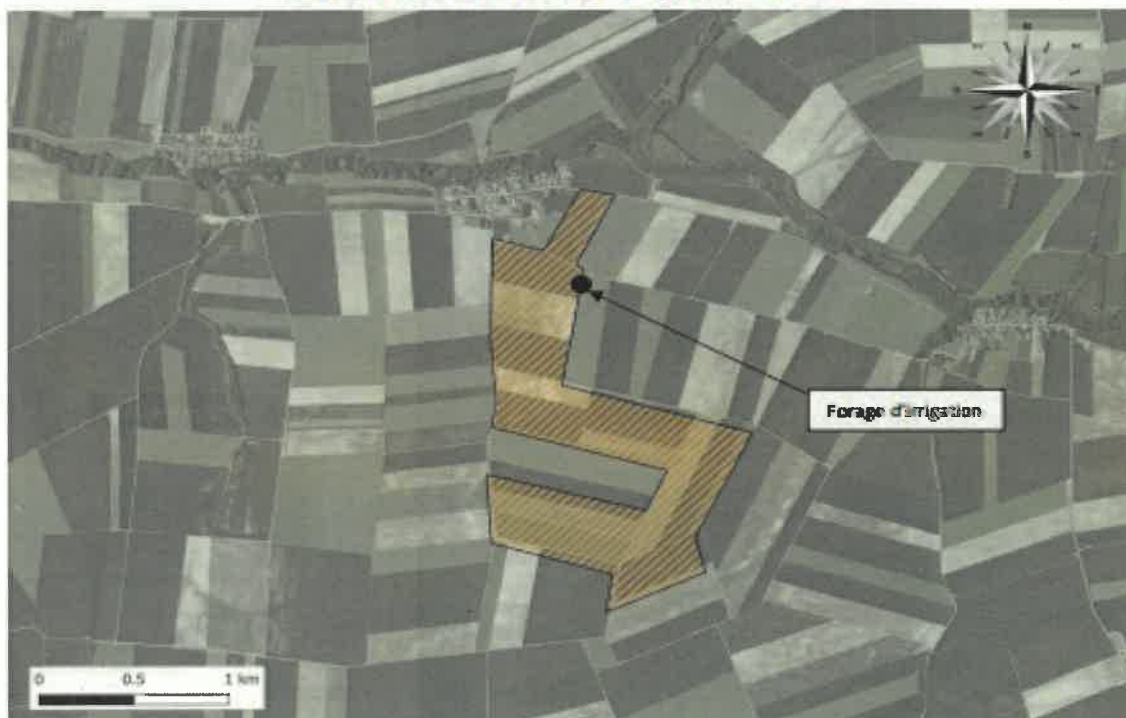
Figure 2 : Localisation du forage d'irrigation sur fond orthophotographique